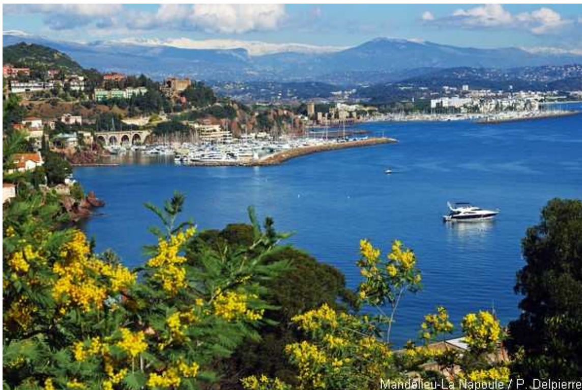
Mandelieu-La Napoule

A Mandelieu-La Napoule, la population est particulièrement sensibilisée à la Provence et à la préservation de son patrimoine, qui s'est forgé depuis la fin du 19 ème siècle sur la culture du mimosa et le développement du tourisme. Ce salon s'inscrit donc tout naturellement dans le programme de la Fête du mimosa 2012.